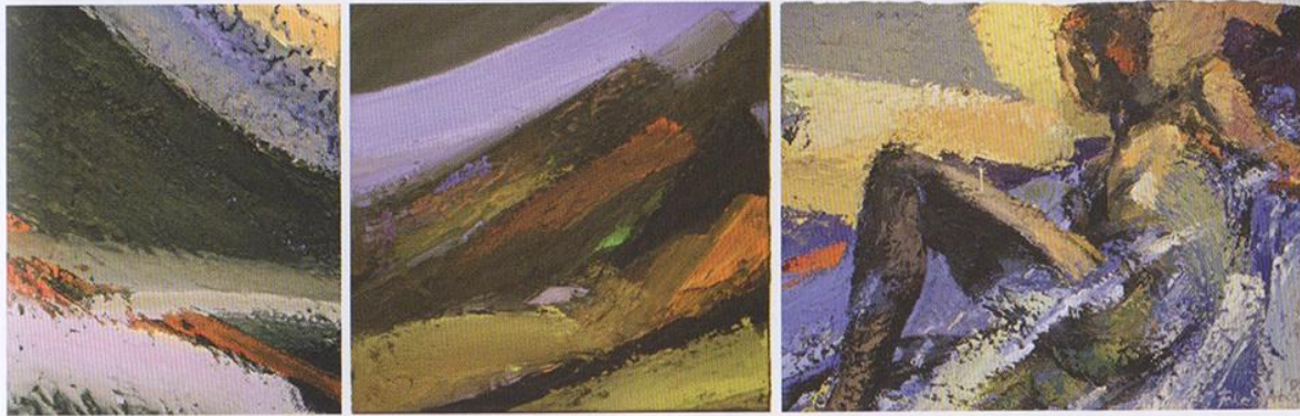
Foke Stribos: Schepping en herschepping, 1994 (90 x 70 cm; 90 x 90 cm en 90 x 120 cm)

al meer. Een baan met water vloeit door het beeld. Het is alsof de grond beweegt en nieuwe vormen bezig zijn te ontstaan. Er ontluikt groen en de aarde lijkt in verwachting van een menselijke vorm.